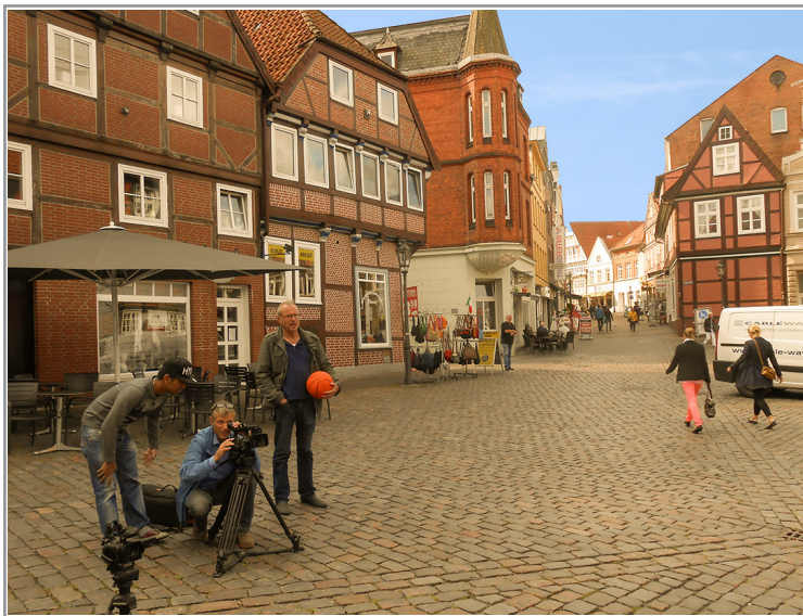
Stader Altstadt als Kulisse eines TRIANGEL – DREHS

Ort“. Auch für die Versorgungsbetriebe ELBE in Lauenburg/Boizenburg ist ein erster Clip entstanden. In den Beratungen mit unseren Kunden haben wir auf die vielfältigen